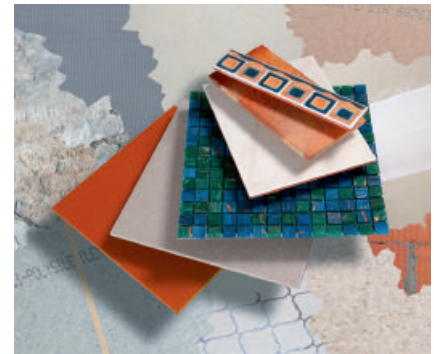
Variables Leistungsspektrum – für alle Untergründe und alle keramischen Beläge.