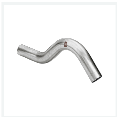
Temponox-Überbogen - Einsteckenden Modell 1709.3